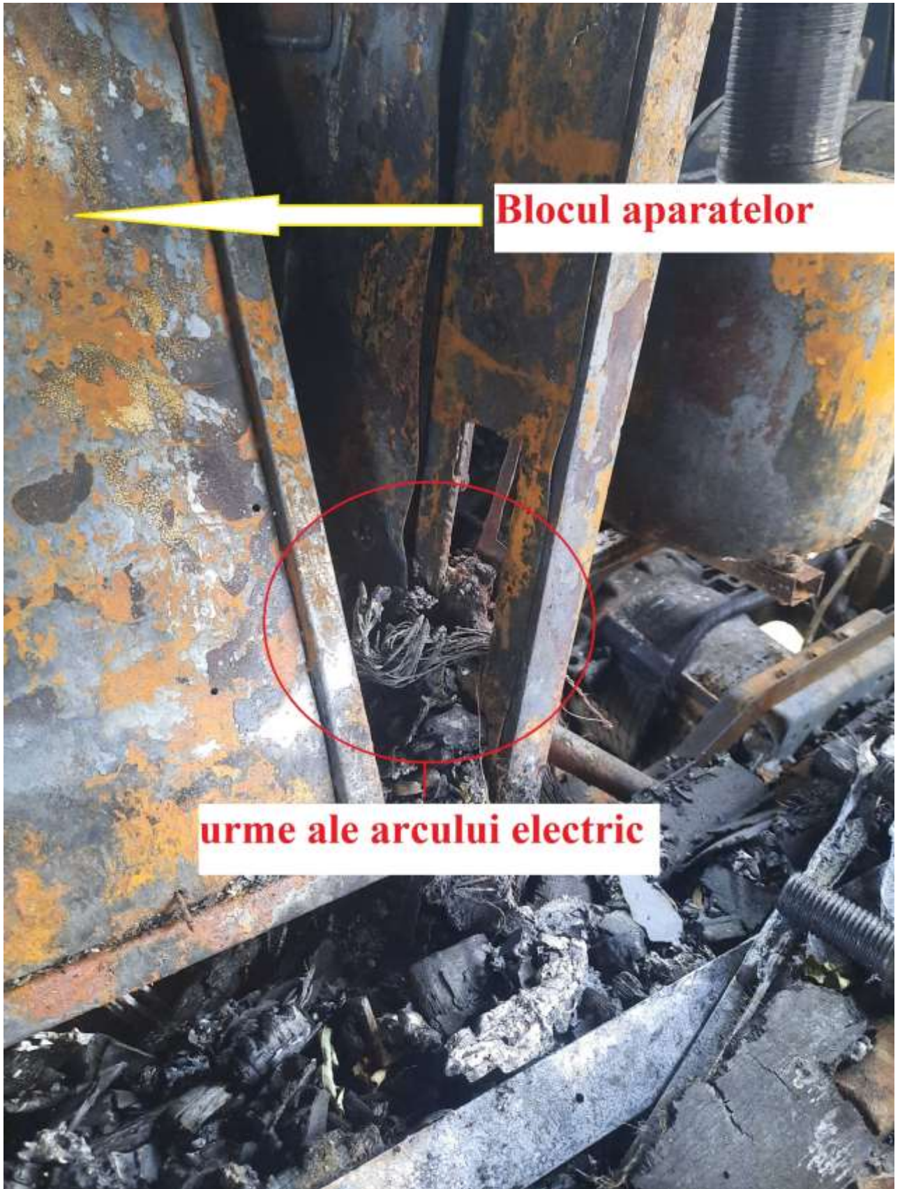
Figura nr.2 – blocul aparatelor (vedere din lateral)