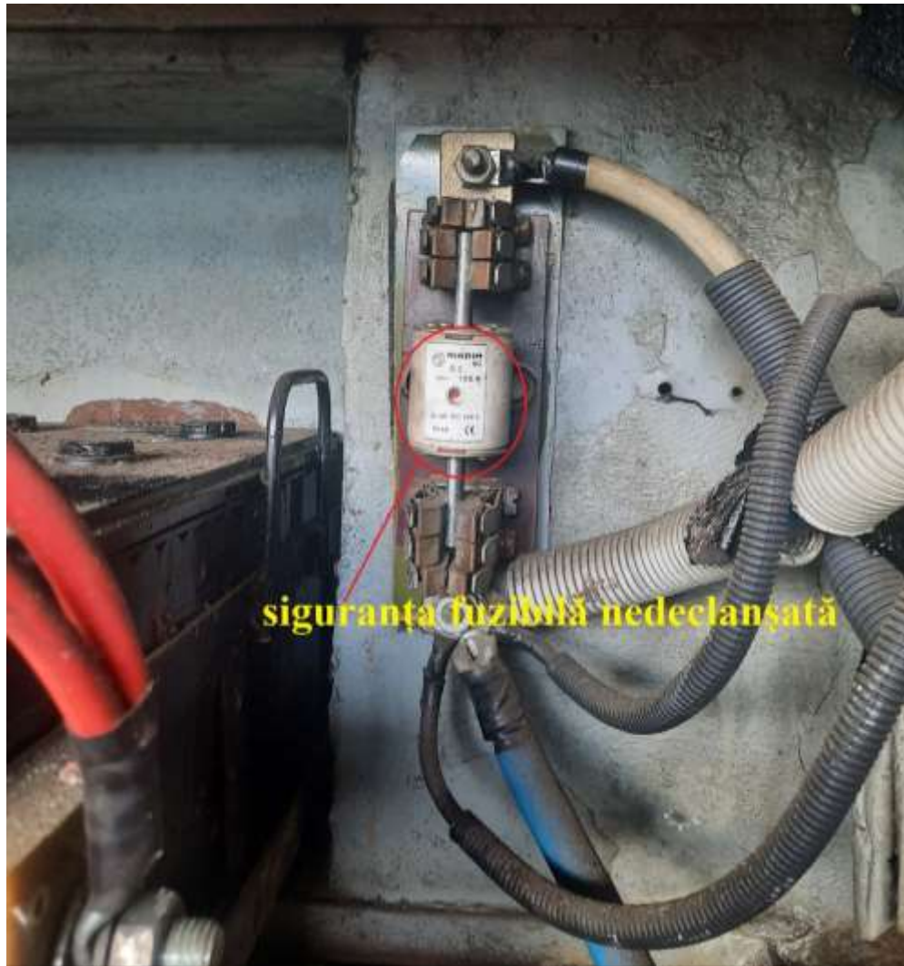
Figura nr.1 – siguranța fuzibilă a bateriei de acumulatori

Cablurile de conexiune a bateriilor de acumulatori nu prezentau urme de arc electric și nici de afectare termică.