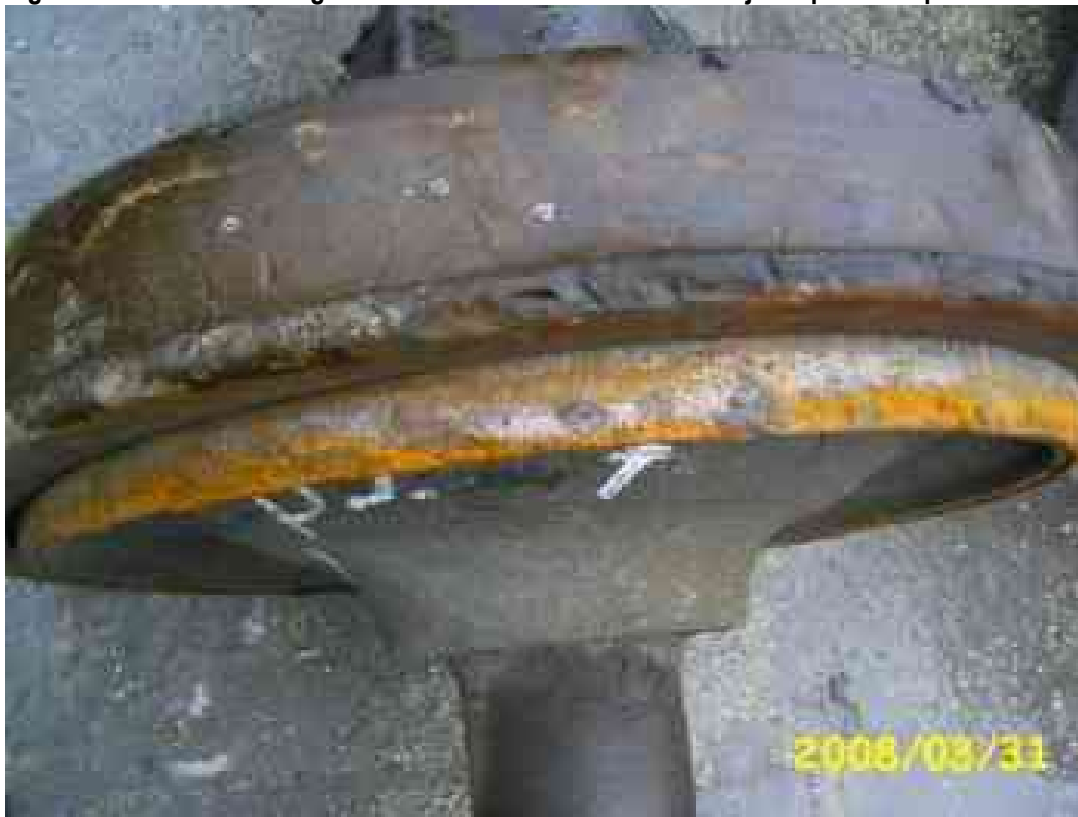
Figura 2 – roata nr. 2 a vagonului nr. 8853 6656 620-0 cu bandajul deplasat de pe obadă