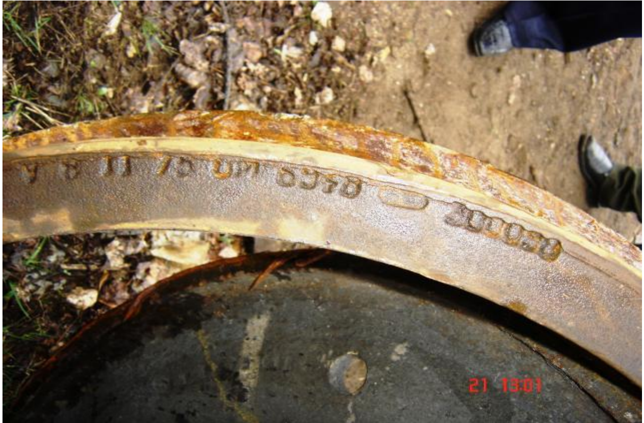
Figura 3 – marcajul bandajului roții nr. 5

Rezultatele verificărilor efectuate la SC UMERVA SA: