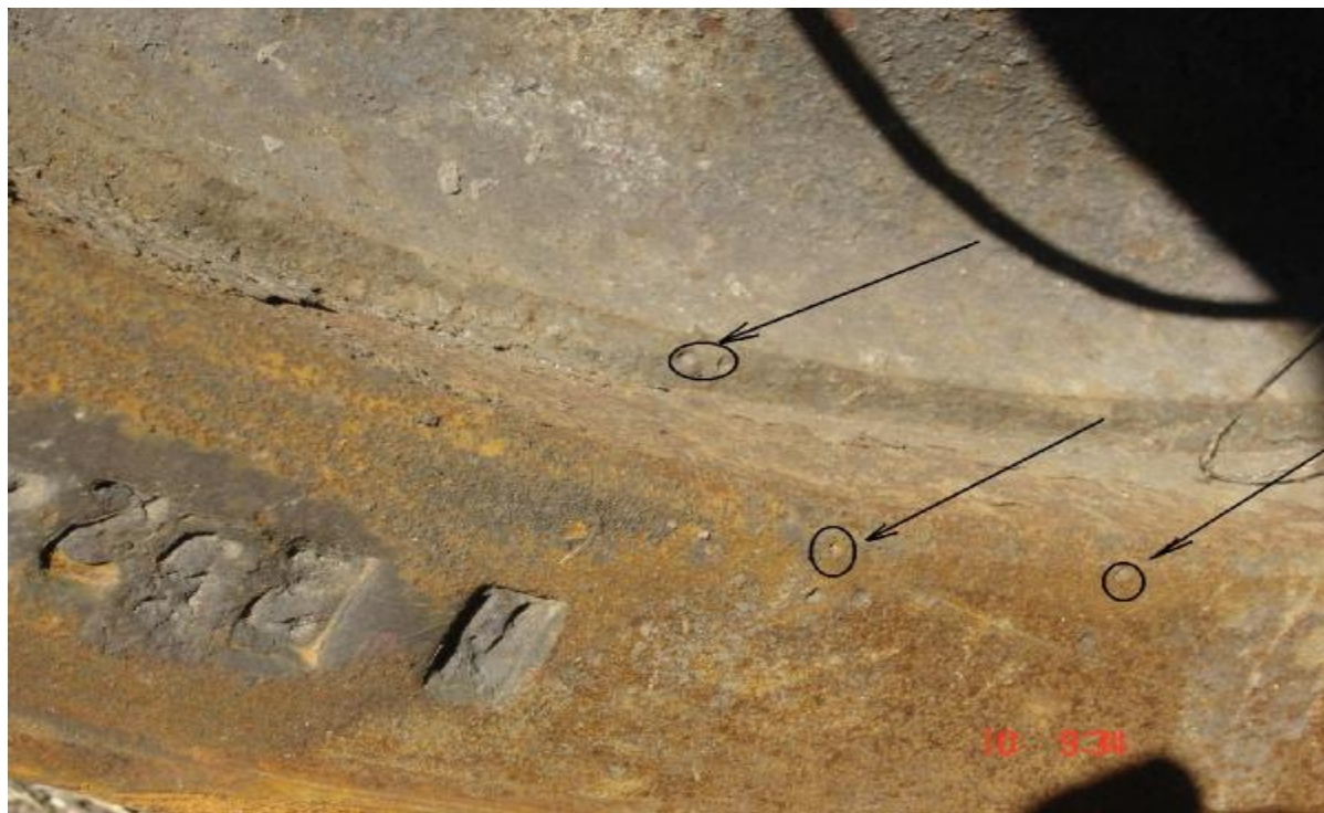
Figura 5 – bandajul roții nr. 5 demontat de pe obada roții