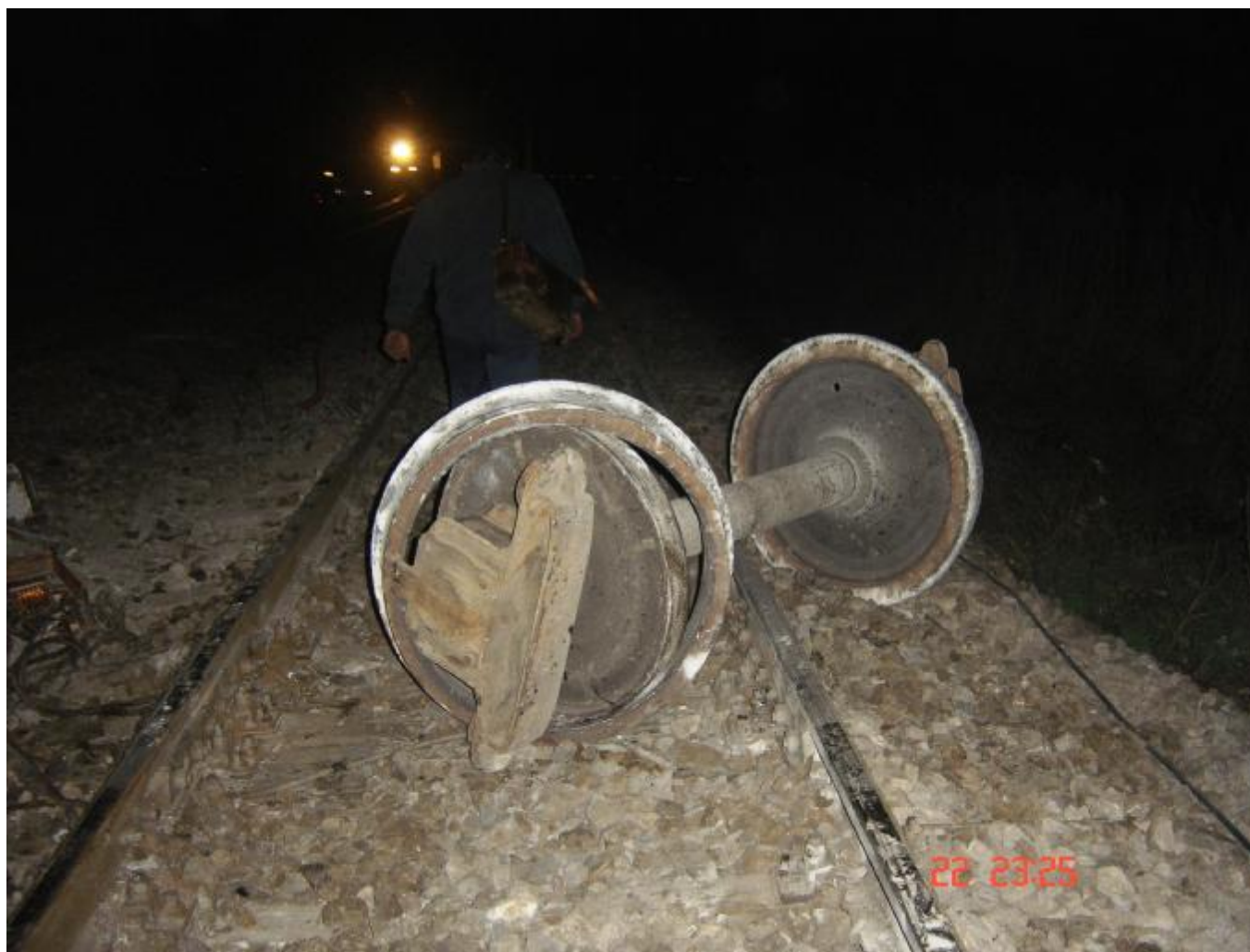
Figura 2 – roata nr. 5 a vagonului nr. 88536657717-3 cu bandajul deplasat de pe obadă